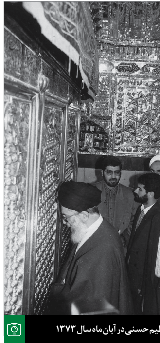
حضور در مرقد مطهر حضرت عبدالعظیم حسنی در آبان ماه سال ۱۳۷۳

تائید می‌رسد به مأمون و ماجرای اصرار و فشار فراوان برای کشتن آن بزرگوار از مدینه به مرو، به خراسان؛ او یک محاسبه‌ای کرده بود که این محاسبه صرفاً سیاسی بود و برای تحکیم پایه‌های قدرت و به ضعف کشاندن حرکت معرفت‌اهل بیت (ع) و کاری که این بزرگوارها می‌کردند، سیاست او این بود. در مقابل این حرکت سیاسی و زیرکانه‌ی مأمون، امام هشتم (ع) یک برنامه‌ی مدبرانه‌ی الهی را طراحی کردند و عمل کردند و پیش بردند که نه فقط خواسته‌های دستگاه خلافت برآورده نشد، بلکه درست بعکس، موجب رواج و گسترش فکر معارفی قرآنی و منتسب به اهل بیت در اقطار دنیای اسلام شد. یک حرکت عظیم، با توکل به خدای متعال، با تدبیر الهی، با آن نگاه نافذ و لوی، امام هشتم (ع) توانستند این نقشه‌ی خصمانه‌ی دستگاه سیاسی قاهر و هتاک و ظالم را درست بعکس و در جهت منافع حق و حقیقت برگردانند. ● ۹۳/۶/۱۶