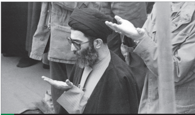
اقامه نماز جمعه تهران به امامت آیت‌الله خامنه‌ای | دهه ۶۰

ملت شریف ایران قدر یک همچو جوانان و قدر یک همچو خانواده‌هایی که این جوانان را تحویل جامعه