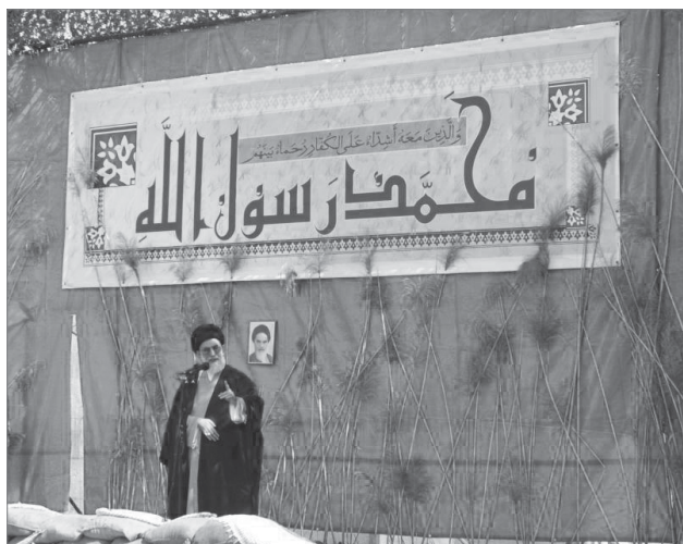
حضور رهبر انقلاب در یادمان شهدای دهلاویه و سخنرانی در جمع مردم دشت آزادگان، حمیدیه و بوستان ۵ فروردین ۸۵