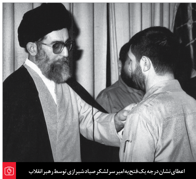
اعطای نشان در چه یک فتح به امیر سر لشکر صیاد شیرازی توسط رهبر انقلاب

موفق نشدند. حتی رسول ختمی - صلی‌الله‌علیه‌وآله‌وسلم - که برای اصلاح بشر آمده بود و برای اجرای عدالت آمده بود... باز در زمان خودشان موفق نشدند به این معنا، و آن کسی که... عدالت را