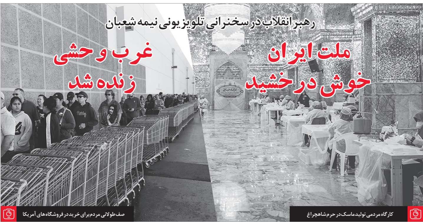
کارگاه مردمی تولید ماسک در حرم شاهچراغ

آن روزی که صنعت هسته‌ای کشور شروع به فعالیت کرد و به آن اوجی که همه می‌دانید رسید، بعضی‌ها بودند -حتّی بعضی از دانشمندان ما، بعضی از نسل‌های قدیمی ما- که به ما می‌گفتند «آقا نکنید، فایده‌ای ندارد، نمی‌شود، نمی‌توانید»؛ بعضی‌ها به خود من نامه می‌نوشتند و می‌گفتند نمی‌توانید. چرا؟ چون آن کسانی که دست‌اندرکار بودند، همه تقریباً جوان بودند؛ اکثر آنها در سنین حدود سی سال و کمتر از سی سال بودند؛ این‌ها توانستند. همان کسانی که منکر بودند، بعداً اعتراف کردند که «بله، اینها واقعا توانستند این کار را انجام بدهند». ● ۹۷/۱/۱۰