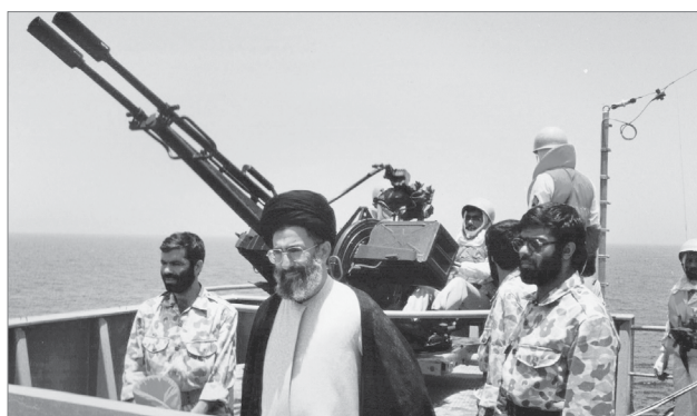
حضور آیت الله خامنه‌ای، رئیس‌جمهور وقت ایران، در مانور مشترک ذوالفقار ۳ / آب‌های خلیج فارس

انسان سنش زیادتر می‌شود، اقبالش به دنیا بیشتر می‌شود. جوان‌ها نزدیک‌ترند به ملکوت. پیرها هر چه می‌گذرد، هر چه بر عمرشان می‌گذرد، هی اضافه می‌شود یک چیزهایی که آنها را از خدا دور می‌کند. شماها