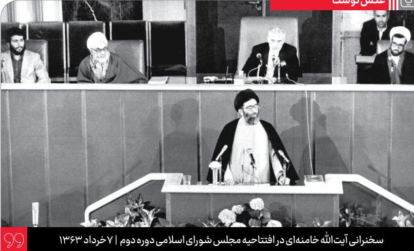
سخنرانی آیت الله خامنه‌ای در افتتاحیه مجلس شورای اسلامی دوره دوم | ۷ خرداد ۱۳۶۳