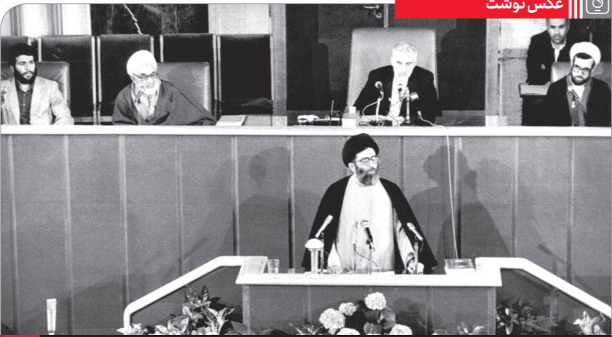
سخنرانی آیت‌الله خامنه‌ای در افتتاحیه مجلس شورای اسلامی دوره دوم | ۷ خرداد ۱۳۶۳