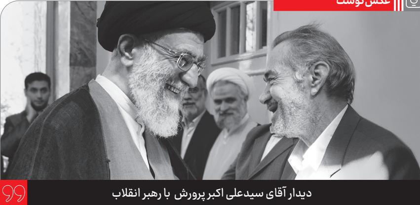
دیدار آقای سیدعلی اکبر پرورش با رهبر انقلاب