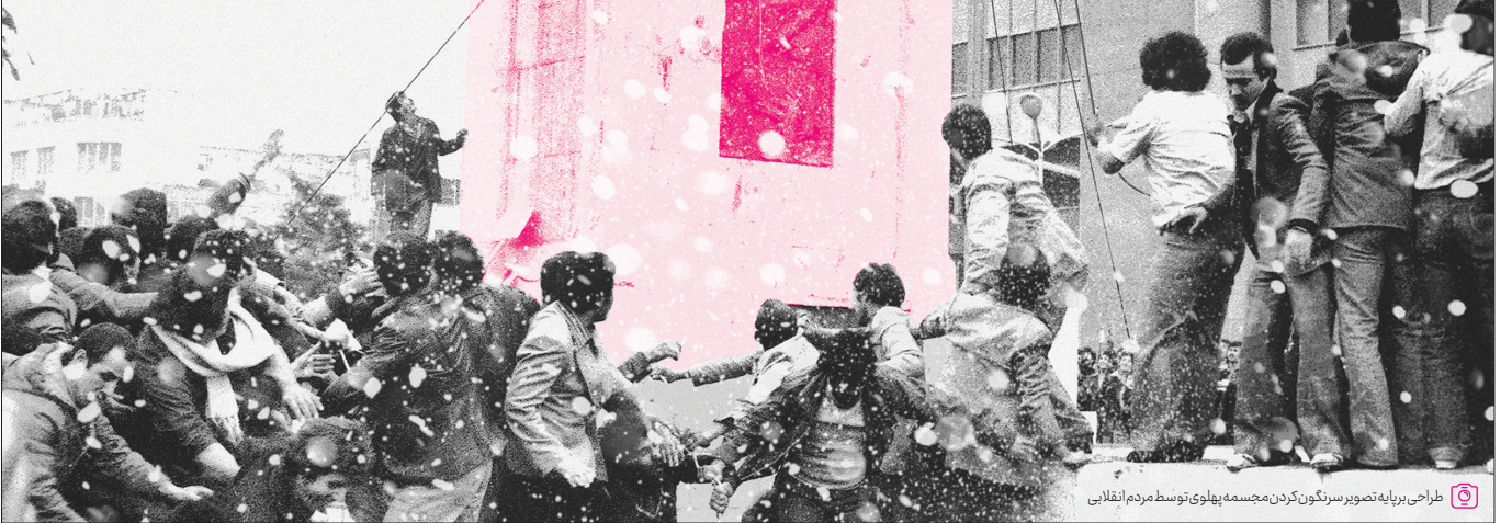
طراحی برپایه تصویر سرنگون کردن مجسمه پهلوی توسط مردم انقلابی