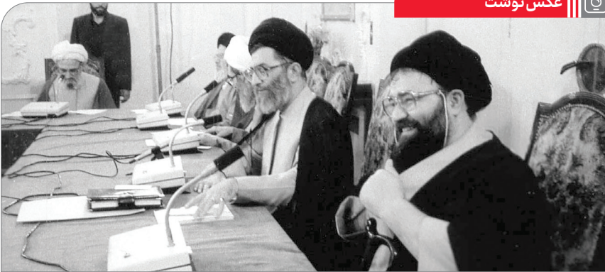
تصویری از مرحوم حاج سیداحمد خمینی در کنار حضرت آیت‌الله خامنه‌ای در جلسه بازنگری قانون اساسی، سال ۱۳۶۸