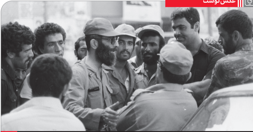
حضور آیت الله خامنه‌ای در بین مدافعان خرمشهر - مهرماه ۱۳۵۹

روز فتح خرمشهر - که نقطه‌ی اوج عملیات «بیت المقدس» است - برای همه‌ی ما و برای تاریخ ما و آینده‌ی ما یک نمونه‌ی درس آموز و عبرت آموز است؛ چون در این روز نیروهای جان برکف ارتش و سپاه، با یک هماهنگی شگفت آور و تحسین برانگیز و باشجاعت و فداکاری غیر قابل توصیفی توانستند یک ضربتی عظیمی وارد کنند؛ نه فقط بر پیکر ارتش عراق،