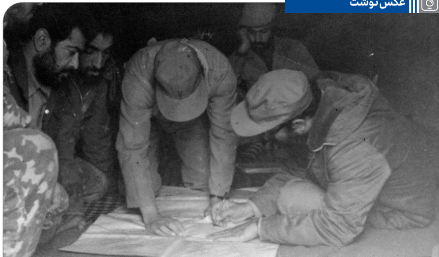
آیت‌الله خامنه‌ای در کنار شهید چمران - مهرماه ۱۳۵۹ | استاد لشگر ۹۲ زرهی نیروی زمینی ارتش اهواز

مرحوم چمران در قضایای قبل از انقلاب، در فلسطین و مصر تمرین دیده بود. به خلاف ما که هیچ سابقه نداشتیم، ایشان سابقه نظامی حسابی داشت و از لحاظ جسمانی هم، از من قویتر و کار کشته‌تر و زنده‌تر بود. لذا، وقتی صحبت شد که «کی فرمانده این عملیات باشد؟» همه نظر دادیم که مرحوم چمران، فرمانده این تشکیلات [ستاد جنگ‌های نامنظم] شود. ۱۱/۶/۷۲