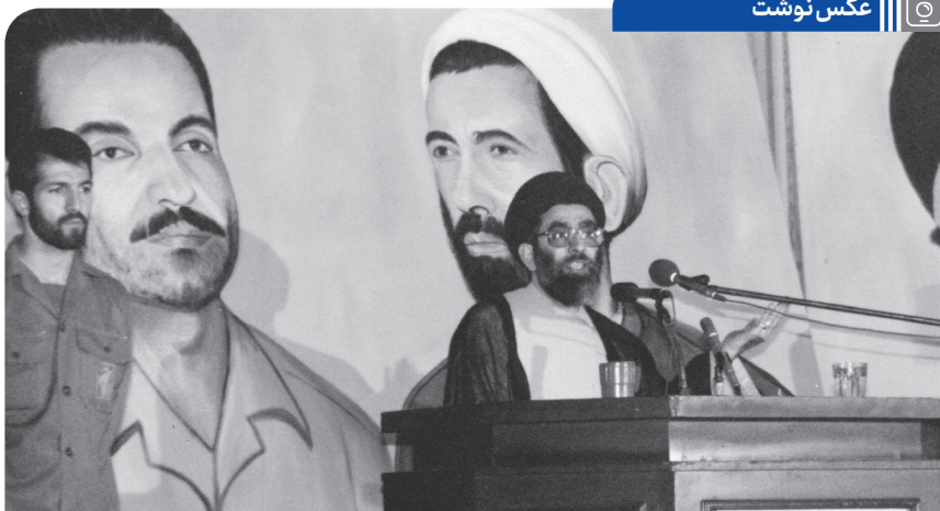
سخنرانی آیت‌الله خامنه‌ای در مراسم دومین سالگرد شهادت شهیدان رجایی و باهنر در مدرسه عالی شهید مطهری. ۱۳۶۲/۶/۸