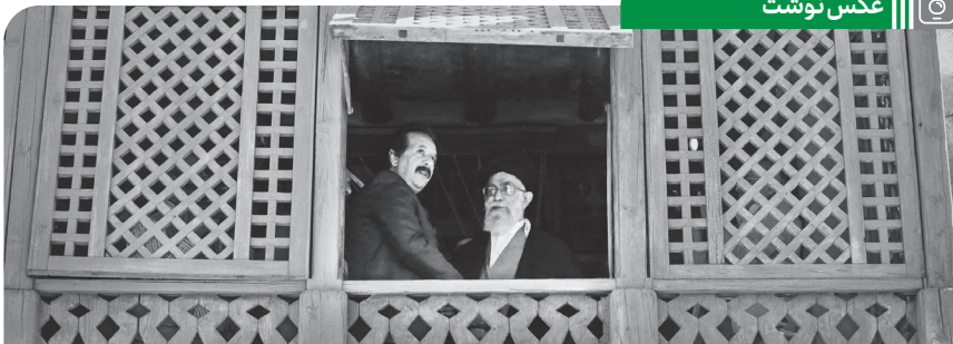
بازدید حضرت آیت الله خامنه‌ای از شهرک سینمایی فیلم محمد رسول الله (ص)، آبان ۱۳۹۱ - باز نشر به مناسبت ۲۱ شهریور، روز سینما