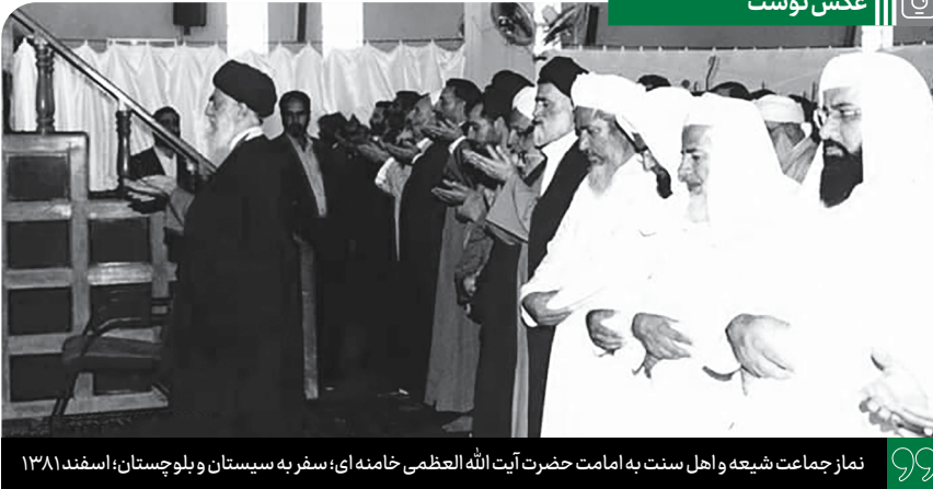
نماز جماعت شیعه و اهل سنت به امامت حضرت آیت الله العظمی خامنه‌ای؛ سفر به سیستان و بلوچستان؛ اسفند ۱۳۸۱

در روایات ما بسیار است روایاتی که راویان آنها از اهل سنتند. از غیر شیعه هستند. اما از حضرت ابی عبدالله الصادق نقل می‌کنند و روایت می‌کنند. معنای این حرف این است که امروز هم دنیای اسلام و امت اسلامی نیازمند معارف امام صادق و اهل بیت است. دنیای اسلام محتاج دانستن معارف اهل بیت و تعالیم امام صادق و سایر ائمه است؛ باید استفاده کنند. قشرهای مختلف و اقسام مختلف امت اسلامی، به این وسیله باید با یکدیگر هم‌افزایی کنند تا سطح معارف اسلامی بالا برود. لازمی این کار این است که حجاب خصومت و دشمنی و کینه‌ورزی میان فرقه‌های مسلمان فاصله نیندازد؛ وحدت اسلامی که می‌گوییم یعنی این. ● ۱۳۸۷/۰۱/۰۱ ۱۷ ربیع الاول، ولادت حضرت امام جعفر صادق علیه السلام (۸۳ هـ ق)