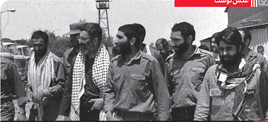
بازدید آیت الله خامنه ای از لشکر ۸ نجف اشرف در سال ۱۳۶۷

۱۹ دی، سالروز قیام خونین مردم قم در سال ۱۳۵۶ گرامی باد