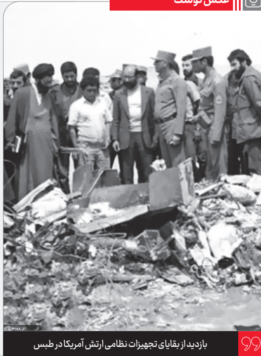
بازدید از بقایای تجهیزات نظامی ارتش آمریکا در طیس

رئیس‌جمهور آمریکا برای نجات این گروگانها [لانه جاسوسی] دست به حمله‌ی نظامی پنهانی و شبانه به ایران زد. جاسوسان نشان را در اینجا بسیج کردند، مقدمات فراوانی فراهم کردند، آدم دیدند، جا دیدند، با هلیکوپتر و هواپیما حمله کردند، آمدند که طیس پیاده شوند و از آنجا بیایند و به خیال خودشان گروگانها را خلاص کنند و ببرند؛ که آن ماجرای معروف طیس اتفاق افتاد، خدای متعال آبروی اینها را برد، هواپیماها و هلیکوپترهاشان آتش گرفت و مجبور شدند از همان طیس برگردند و بروند. ۱۳۹۸/۰۸/۱۲