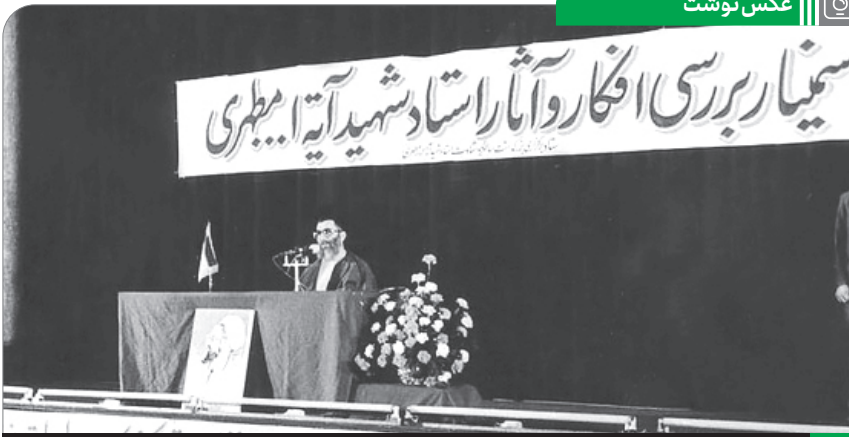
سخنرانی آیت‌الله خامنه‌ای در سمینار افکار و آثار شهید مطهری در تاریخ ۱۳۶۶/۰۲/۰۵

مرحوم آقای مصباح رحمته‌الله‌علیه یک استاد فکر بود؛ البته ایشان کارهای سیاسی و فکرهای سیاسی هم میکردند، درباره‌ی آنها [یعنی] مسائل سیاسی بحثی ندارم، [لکن] درباره‌ی مسائل فکری یک راهنما و مرشدی بود که میتوانست مرجع و ملجأ باشد. این جور آدم‌ها لازمند که استاد فکر باشند؛ همچنانی که علم استاد میخواهد، فکر هم استاد میخواهد. ● ۱۴۰۱/۰۲/۰۶ فقیه و فیلسوف معاصرمان، مرحوم آیت‌الله مصباح یزدی هم انصافاً شاگرد شایسته‌ی امام بود و هم در غیرت دینی در اوج بود، هم در عقلائیّت، یک فیلسوف به معنای واقعی کلمه بود. ● ۱۴۰۰/۱۰/۱۹ ایشان متفکری برجسته، مدیری شایسته، دارای زبان گویائی در اظهار حق و پای با استقامتی در صراط مستقیم بودند. خدمات ایشان در تولید اندیشه‌ی دینی و نگارش کتب راه‌گشا، و در تربیت شاگردان ممتاز و اثرگذار، و در حضور انقلابی در همه‌ی میدان‌هایی که احساس نیاز به حضور ایشان میشد، حقاً و انصافاً کم‌نظیر است. ● ۱۳۹۹/۱۰/۱۳