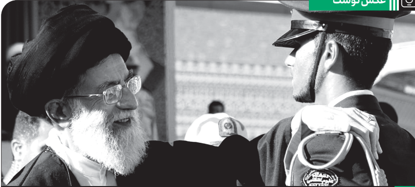
حضور فرمانده کل قوا در مراسم هفدهمین دوره دانش آموزی دانشجویان دانشگاه علوم انظامی، ۱۳۸۶/۸/۱۶

امام حسن عسگری علیه السلام می‌تواند الگوی همه‌ی مؤمنان، بخصوص جوانان باشد. این امامی که موافقان، شیعیان، مخالفان، غیر معتقدان، همه، شهادت دادند و اعتراف کردند به فضل او، به علم او، به تقوای او، به طهارت او، به عصمت او، به شجاعت او در مقابل دشمنان، به صبر و استقامت او در برابر سختیها، این انسان بزرگ، این شخصیت باشکوه، وقتی به شهادت رسید، فقط بیست و هشت سال داشت. در تاریخ پرافتخار شیعه، این نمونه‌ها را کم نداریم. پدر امام زمان عزیز ما با آن همه فضیلت، با آن همه مقامات، با آن همه کرامات، وقتی با سم و جنایت دشمنان از دنیا رفت، فقط بیست و هشت سال داشت؛ این میشود الگو؛ جوان احساس میکند یک نمونه‌ی عالی در مقابل چشم دارد. ● ۱۳۹۰/۱۲/۱۰