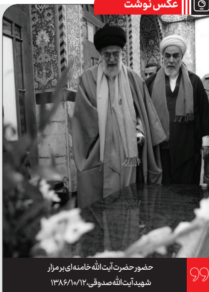
حضور حضرت آیت الله خامنه ای بر مزار شهید آیت الله صدوقی، ۱۳۸۶/۱۰/۱۲