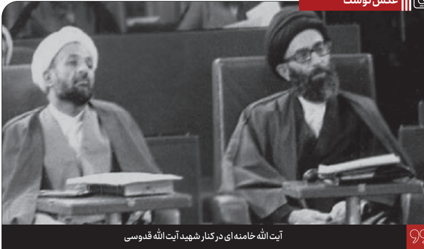
آیت الله خامنه‌ای در کنار شهید آیت الله قدوسی