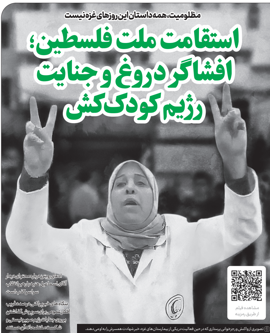
اهدای رویترز درباره محتوای دیدار آقای اسماعیل هنیه با رهبر انقلاب سرانسرکتاب است

حملات رژیم ددمنش اسرائیل با استفاده از بمب‌های ممنوعه و فسفری، مظلومیت در غزه را به اوج خود رسانده. این رژیم هیچ جای امنی برای مردم باقی نگذاشته و حتی مسجد، مدرسه و کلیسا را هدف قرار می‌دهد؛ «ملت‌ها در بسیاری از مواقع مظلوم واقع شده‌اند، اما دشمن آنها این قدر بی‌حیا، ادامه در صفحه ۳