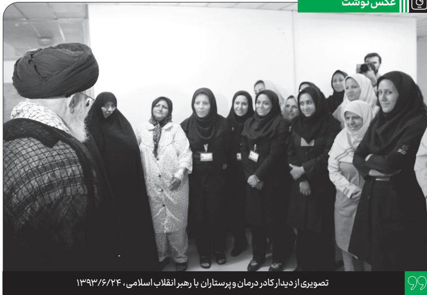
تصویری از دیدار کادر درمان و پرستاران با رهبر انقلاب اسلامی، ۱۳۹۳/۶/۲۴

مرحوم آقای طباطبائی رحمته‌الله‌علیه توانست یک پایگاه فکری مستحکم با آرایش تهاجمی به وجود بیاورد؛ یعنی آن کسانی که با افکار ایشان آشنا میشدند، موضعشان در مقابل مارکسیسم و در مقابل افکار گوناگون موضع تدافعی نبود، موضع تهاجمی بود... این پایگاه فکری را آقای طباطبائی به وجود آورد؛ هم با اصول فلسفه و هم با بیانات تفسیری که این تفسیر، دریایی از معارف سیاسی و اجتماعی است... این کتاب المیزان سرشار است از مسائل سیاسی و اجتماعی که آن زمان اصلاً این مسائل مطرح نبود... این، آن کاری است که به نظر من ماها باید این کار را از آقای طباطبائی یاد بگیریم؛ تشکیل پایگاه‌های فکری پُرکننده‌ی خلاها و دارای جنبه‌ی تهاجم، نه موضع انفعالی و تدافعی. ● ۱۴۰۲/۸/۱۷