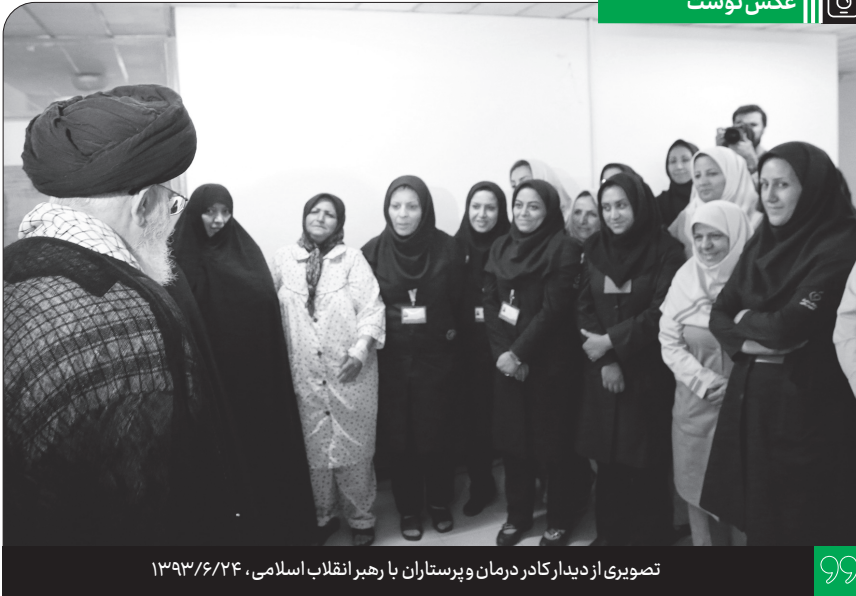
تصویری از دیدار کادر درمان و پرستاران با رهبر انقلاب اسلامی، ۱۳۹۳/۶/۲۴

مرحوم آقای طباطبائی رحمته‌الله‌علیه توانست یک پایگاه فکری مستحکم با آرایش تهاجمی به وجود بیاورد؛ یعنی آن کسانی که با افکار ایشان آشنا میشدند، موضعشان در مقابل مارکسیسم و در مقابل افکار گوناگون موضع تدافعی نبود، موضع تهاجمی بود... این پایگاه فکری را آقای طباطبائی به وجود آورد؛ هم با اصول فلسفه و هم با بیانات تفسیری که این تفسیر، دریایی از معارف سیاسی و اجتماعی است... این کتاب المیزان سرشار است از مسائل سیاسی و اجتماعی که آن زمان اصلاً این مسائل مطرح نبود... این، آن کاری است که به نظر من ماها باید این کار را از آقای طباطبائی یاد بگیریم؛ تشکیل پایگاه‌های فکری پُرکننده‌ی خلأها و دارای جنبه‌ی تهاجم، نه موضع انفعالی و تدافعی. ● ۱۴۰۲/۸/۱۷