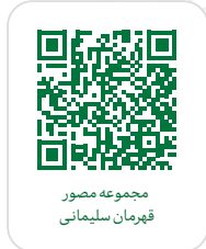
مجموعه مصور قهرمان سلیمانی