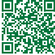
نمودار کلان بیانات رهبران انقلاب درباره شهید حاج قاسم سلیمانی