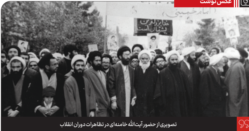
تصویری از حضور آیت الله خامنه ای در تظاهرات دوران انقلاب