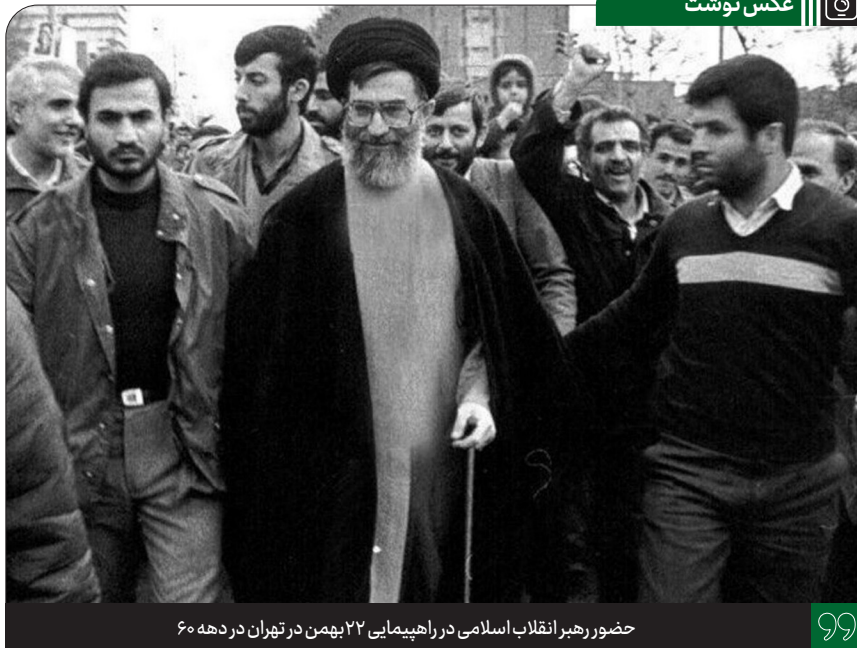
حضور رهبر انقلاب اسلامی در راهپیمایی ۲۲ بهمن در تهران در دهه ۶۰