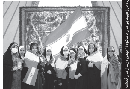
تصاویری از حضور مردم در راهپیمایی‌های باشکوه ۲۲ بهمن در سال‌های گذشته

حضور پرشور و شعور مردم در چهل و پنج جشن ملی برای انقلاب اسلامی ایران نشانه چیست؟