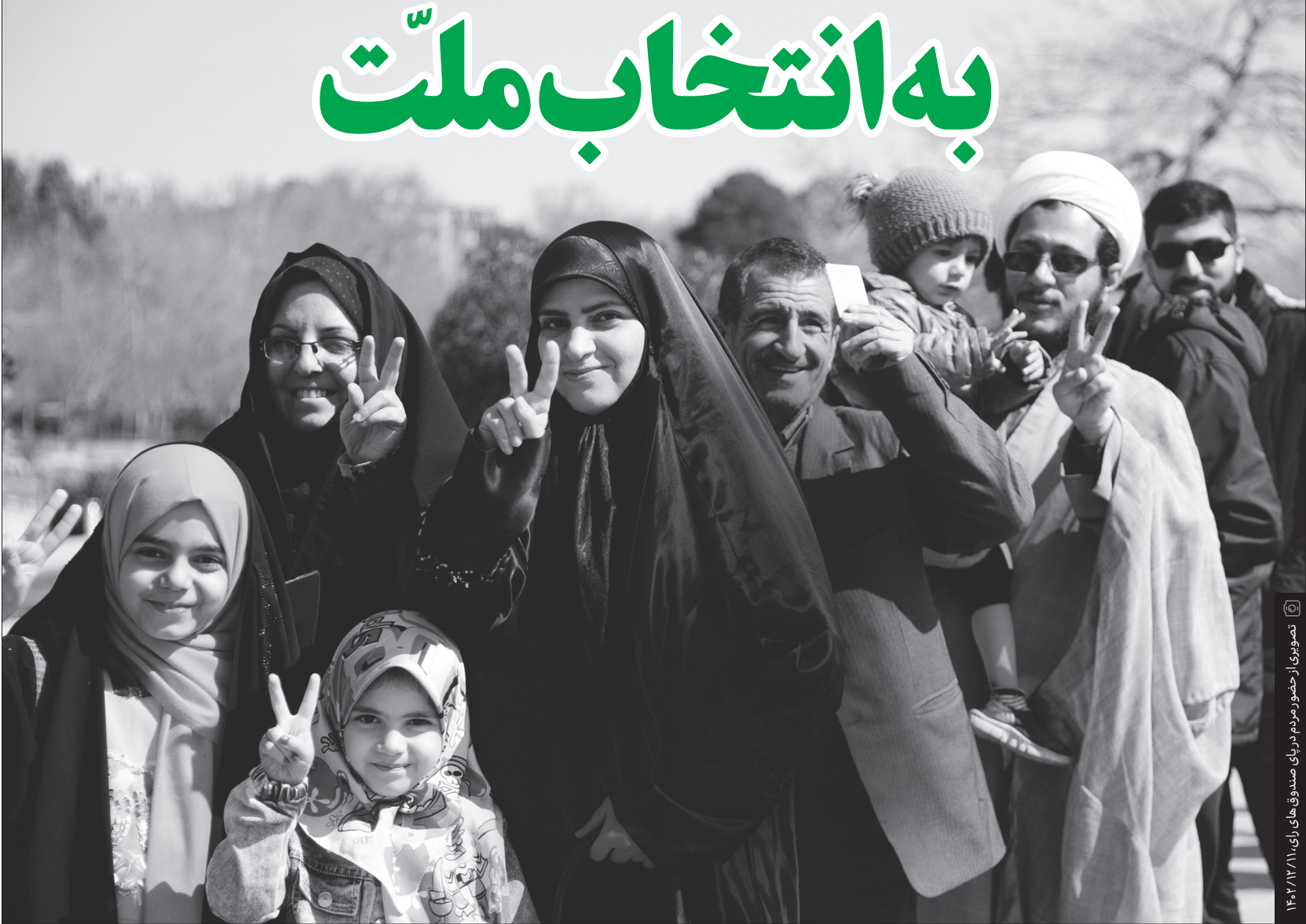
تصویر رستم در مراسم عزاداری سیدالشهدا در ۱۳۸۲

نشریه جامعه مؤمن و انقلابی هفته‌نامه خبری-تبیینی نمازهای جمعه، مساجد و هیئت‌های مذهبی | سال هفتم، شماره ۴۳۴ | هفته سوم اسفند ۱۴۰۲ | www.jameh.org