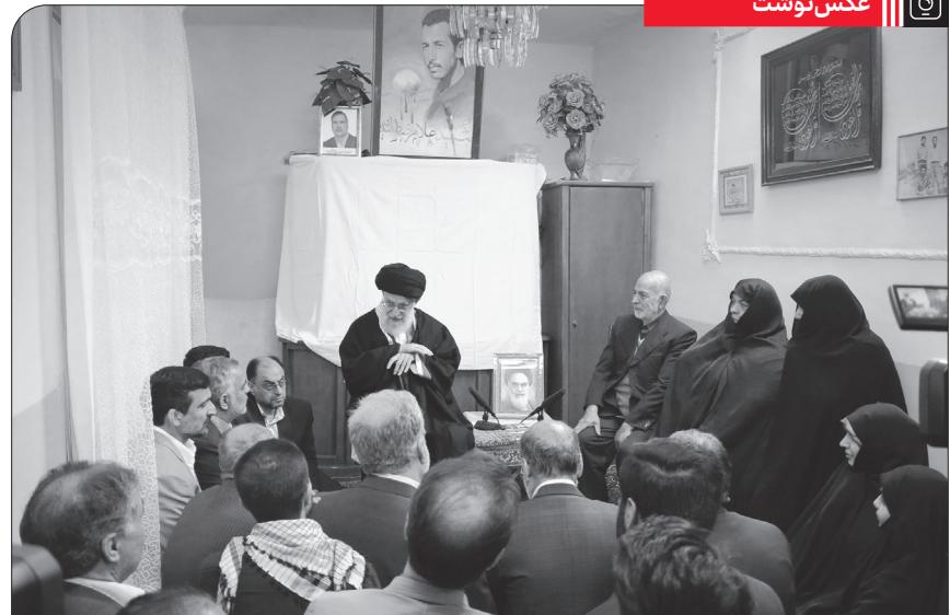
حضور نوروزی رهبر معظم انقلاب در منزل شهید غلامرضا صدیانی از شهدای دوران دفاع مقدس در مشهد مقدس، ۱۳۹۶/۱/۶