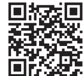
مشارکت در فراخوان از طریق رمزینه

رهبر انقلاب اسلامی در پیام نوروزی، سال ۱۴۰۳ را سال «جهش تولید با مشارکت مردم» نام گذاری کردند و بر همین اساس رسانه KHAMENEI.IR از مخاطبین خود دعوت می کند تا پیشنهادها، نظرات و ایده های خود را برای تحقق مشارکت مردم در جهش تولید، ارسال نمایند. پیشنهادهای دریافت شده پس از دسته بندی به مرور منتشر می شود و نظرات و راهکارهای مطرح شده برای عملیاتی شدن مشارکت مردمی در عرصه تولید، به دستگاه های مربوطه ارجاع داده خواهد شد.