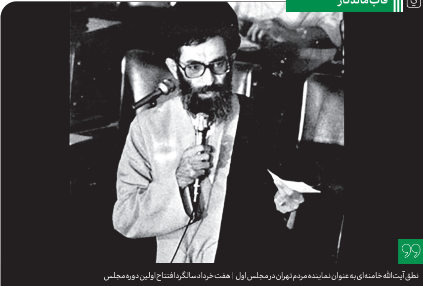
نطق آیت‌الله خامنه‌ای به عنوان نماینده مردم تهران در مجلس اول | هفت خرداد سالگرد افتتاح اولین دوره مجلس

[مسلمین] باید حقوق متقابلی را نسبت به هم عمل کنند. پیغمبر این را عملی کرد: دو به دو مسلمانها را با هم برادر کرد... یک مثال دیگر برای اینکه نشان بدهیم پیغمبر چگونه فضای جامعه را با ارزشهای اسلامی می‌آغشت، روح وفاداری است که در اسلام بسیار مهم است؛ حق شناسی و پاس زحمت و خدمت افراد را داشتن - منهای عقاید و سلاقی سیاسی و خط و ربط و بقیه‌ی امور- که در سلامت جامعه بسیار مؤثر است و پیغمبر عملاً روی این تکیه‌ی زیادی می‌فرمودند؛ یعنی به زبان اکتفا نمی‌کرد که بفرماید پاس عهد و پیمان یکدیگر را داشته باشید و نسبت به یکدیگر حق شناسی داشته باشید؛ بلکه پیغمبر اکرم در عمل هم این فضا را به وجود می‌آورد. ● ۱۳۶۸/۰۷/۲۸