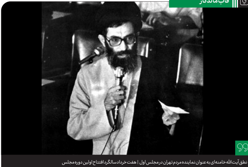
نطق آیت‌الله خامنه‌ای به عنوان نماینده مردم تهران در مجلس اول | هفت خرداد سالگرد افتتاح اولین دوره مجلس