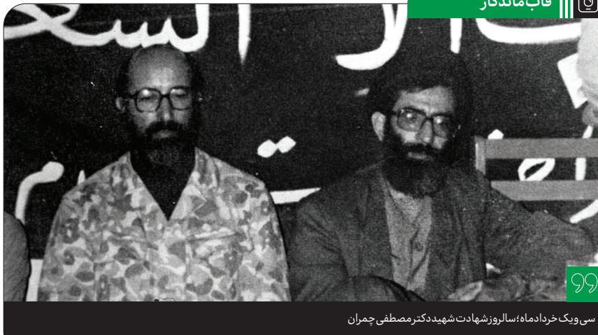
سی و یک خردادماه؛ سالروز شهادت شهید دکتر مصطفی چمران