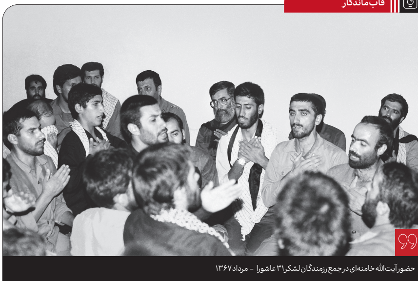
حضور آیت‌الله خامنه‌ای در جمع رزمندگان لشکر ۳ عاشورا - مرداد ۱۳۶۷