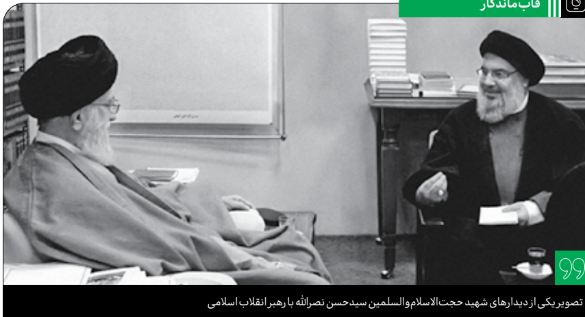
تصویری از دیدارهای شهید حجت‌الاسلام و السلمین سید حسن نصرالله با رهبر انقلاب اسلامی