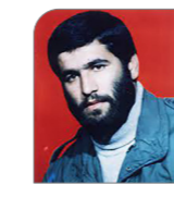
۱۳۶۳/۱۲/۲۶ هورالعظیم گلزار شهدای گله محله پابل، مازندران

به فکر مادیت و این دنیا نباشید که همه اینها آزمایش است برای انسان. سعی کنید بیشتر به فکر آخرت باشید و به فکر معاد و به فکر مردن باشید به فکر آن روزی بیافیتد که خداوند از همه کس حساب می‌کشد و می‌گوید ای انسان که من تو را خلق کرده‌ام و به تو انوع و اقسام نعمتها داده‌ام! تو در دنیا چکار کرده‌ای؟ آیا به خدا و روز معاد ایمان آورده‌ای؟ برادران بهوش باشید که نکنند خدای نکرده اسیر دنیا شوید که دیگر پس از مدتی توبه قبول نمی‌شود. در نماز خواندن کاهلی نکنید و همواره پیرو ولایت فقیه باشید تا با دید وسیع در خط اصیل انقلاب اسلامی به رهبری حضرت امام خمینی قدم بردارید.