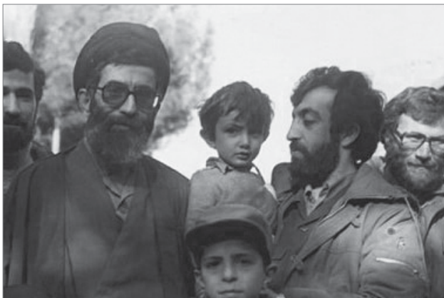
تصویری از آیت‌الله خامنه‌ای در کنار شهیدان محمد بروجردی و مجید حداد عادل

شب‌ها، شب‌های ماه رمضان بود. برادران خوزستانی پس از افطار در راهروی زندان جمع می‌شدند، پتومی انداختند، چای درست می‌کردند و قلیان می‌کشیدند. من از داخل سلول، آنها را نگاه می‌کردم. بعد که به من هم اجازه‌ی بیرون آمدن در راهرو را دادند، در برنامه‌های آنها شرکت می‌کردم. قرار شد هر شب برای آنها صحبت کنم؛ بعد هم سید کاظم - یکی از آنان که صدای خوبی داشت به خواندن مداحی و مرثیه‌خوانی بپردازد و طبق معمول، به ذکر مصیبت امام حسین (علیه السلام) برسد. صحبت‌های من به صورت غیر صریح، متضمن محکوم‌سازی رژیم حاکم بود. درباره‌ی زندگی امیرالمؤمنین علی (علیه السلام) و عدالت آن حضرت، و نیز ویژگی‌های حاکم اسلامی، سخن می‌گفتم. آنها از این سخنان، خشنود و خوشحال می‌شدند. تعجبی هم نداشت؛ زیرا این سخنان، متناسب با آرمان‌های آنها و امیدها و رنج‌هایشان بود. هر شب یکی از افراد جلسه، مسئولیت پرداخت هزینه‌ی آن را داشت؛ البته به جز من، که کاملاً بی پول بودم. ● منبع: کتاب خون دلی که لعل شد