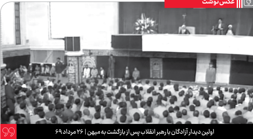
اولین دیدار آزادگان با رهبر انقلاب پس از بازگشت به میهن | ۲۶ مرداد ۶۹

از حالا به بعد تکلیف نسل جوان کنونی و عمدتاً دانشجویی همین است که این خطر را در همان جهت گیری، به سوی تکامل بیشتر ادامه بدهد و پیش برود... کار مال شماست. این نسلی که ما هاد آن حضور داشتیم و فعال بودیم و نیروی جوانی داشتیم و جوانی مان را مصرف کردیم، ربه اضمحلال است... در آینده مسئولیت های کشور با شماست... می توانید همین راه را ادامه بدهید، آن را به تکامل برسانید، از ظرفیت های استفاده نشده