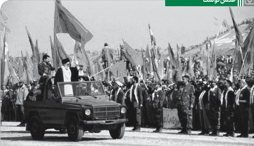
بازدید رهبران انقلاب از اجتماع صد و ده هزار نفری بسیجیان در اردوی فرهنگی رزمی یاران امام علی (ع) ۷۹/۷/۲۹