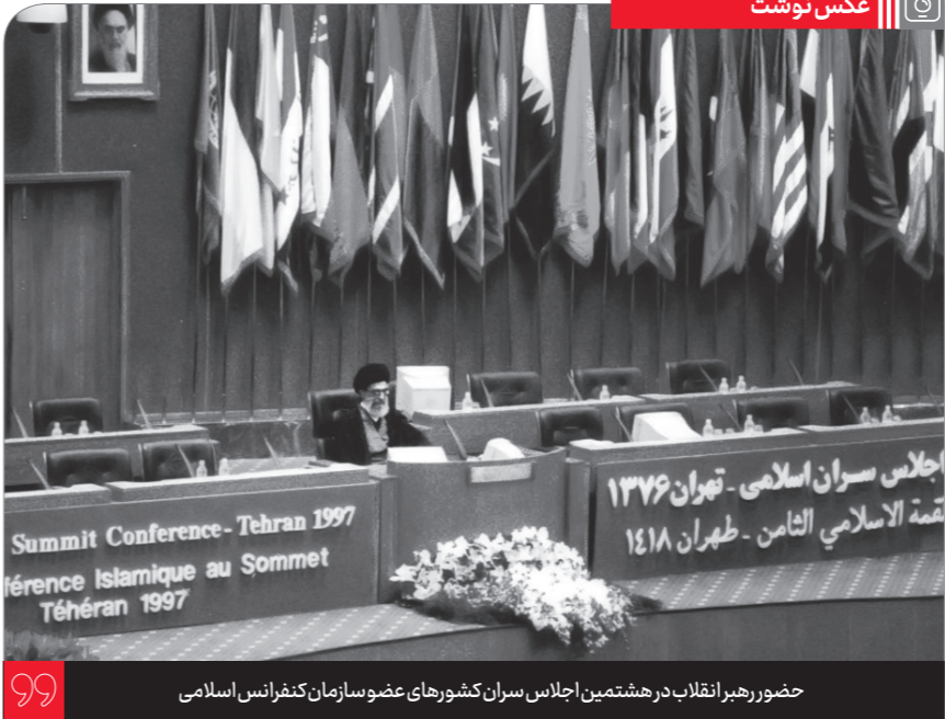
حضور رهبر انقلاب در هشتمین اجلاس سران کشورهای عضو سازمان کنفرانس اسلامی