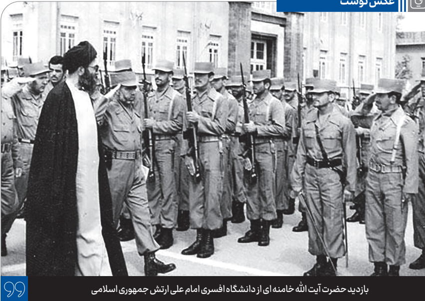
بازدید حضرت آیت‌الله خامنه‌ای از دانشگاه افسری امام علی ارتش جمهوری اسلامی

راحت‌تر مسائل شرعی کمک می‌کند. همچنین در بیان برخی مسائل شرعی مانند حدّ ترخص و مسافت شرعی که برای توضیح آنها در بیشتر رساله‌های عملیه از اصطلاحات و مقادیر قدیمی همچون فرسخ استفاده می‌شود، با تحقیقی بدیع و دقیق مقیاس متناظر آن اصطلاحات با متر و کیلومتر مشخص شده است. شایان ذکر است که معظم‌له این رساله را مورد تأیید و عمل به آن را مجزی اعلام نموده‌اند که متن دستخط و مهر و امضای ایشان در پشت جلد کتاب منتشر شده است.