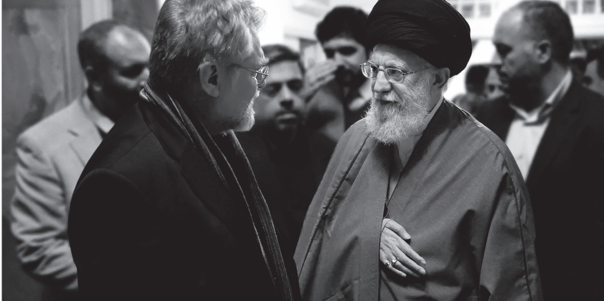
دیدار مرحوم طالب‌زاده جمعی از هنرمندان باحضرت آیت‌الله خامنه‌ای